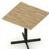
TB CS 80