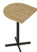
TB CSC 80H