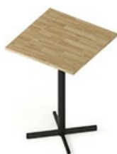
TB CS 80H