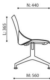
SH 22X 1N