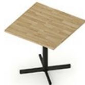
TB CS 80