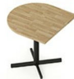
TB CSC 80