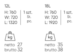
SNR TB 12L/18L

Die Abmessungen sind ungefähr und können je nach ausgewählter Produktkonfiguration ändern. Die Anforderungen der Norm werden immer erfüllt.