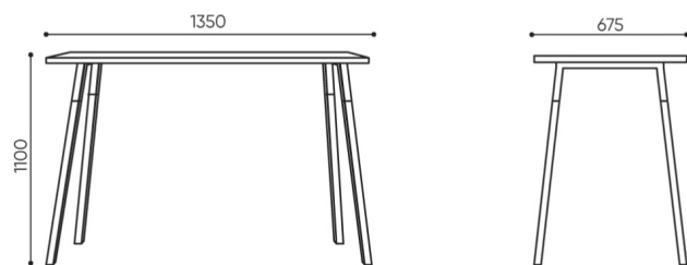
OT W 4L AA H

Wagi dla stolików z blatem z płyty laminowanej. Weights for tables with laminated board top. Gewichte für Tische mit Laminatplatte. Poids pour les tables avec plateau en stratifié.