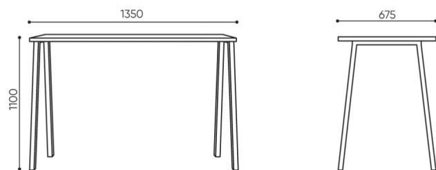
OT 4L AH

Wagi dla stolików z blatem z płyty laminowanej. Weights for tables with laminated board top. Gewichte für Tische mit Laminatplatte. Poids pour les tables avec plateau en stratifié.